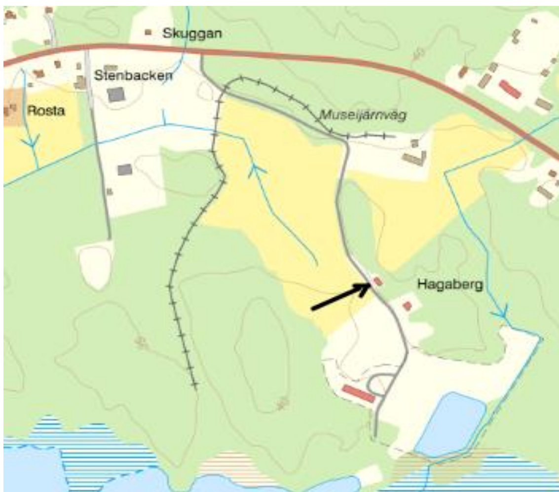
Hantverksstugan, Hagaberg (reningsverket) Näsbybacka 122 i Frövi

Ny lokal: Hantverksstugan, se karta & adress nedan.